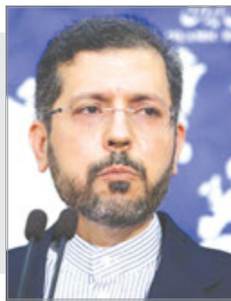
ایران برای هر سناریویی آمادگی دارد