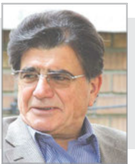
سنگ مزار محمدرضا شجریان آماده شد