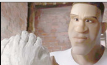
بسکتبال با تهیه‌کنندگی یک انیمیشن کوتاه وارد عرصه انیمیشن‌سازی شد.

به گزارش ایسنا و به نقل از وب‌ایتی، «شکیل اونیل» بسکتبالیست مشهور و سابق آمریکایی برای نخستین‌بار