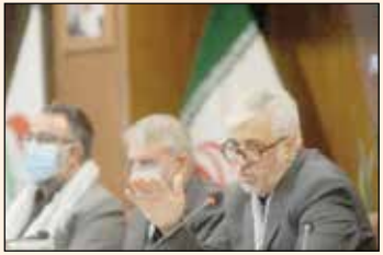
وزیر ورزش به سفر یکی

منتشر شده که وزیر ورزش حرف‌های قابل توجهی را درباره سفر یکی از تیمهای ورزشی زده است. صحبت‌های حمید سجادی را بخوانید: در ماه محرم و صفر تیمی با پول بیت‌المال عازم خارج از کشور می شود، در خارج از کشور باید چیزهایی رعایت شود که برخی موارد رعایت نمی‌شود و وقتی این مسائل به ما گزارش می شود سردرد می گیریم. چه گذشت بر این تیم؟ مری کجاست؟ سرپرست تیم کجاست؟ ورزشکار کجاست؟ مگر آن تیم مسابقه ندارد؟ خرید و گردش اینقدر مهم است؟ اینکه مخاطب صحبت‌های وزیر ورزش کدام تیم است، چیزی است که با پیگیری اخبار ورزشی در طول یکماه گذشته کاملاً متوجه تیم مربوطه خواهید شد. تیمی که سفرش به خارج از کشور، حواشی مختلفی را در پی داشت و حرف و حدیث‌های زیادی درباره اتفاقات رخ داده در این سفر خارجی منتشر شده است. نکته قابل توجه اینکه قرار بود یکی از همراهان تیم مربوطه، گزارشی از آن سفر به مدیران تیمش بدهد و اگر چه آن فرد مدعی شده بود که گزارشی تحویل مدیران تیمش نداده اما به نظر می‌رسد این گزارش در اختیار وزیر ورزش قرار گرفته است.