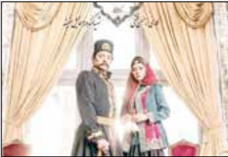
همایون شجریان در کنار همایون شجریان پسرش

همایون شجریان عنوان‌بندی پاپایی سریال «حیران» ساخته حسن فتחי را خواند. به گزارش ایسنا، همایون شجریان عنوان‌بندی پاپایی سریال عاشقانه حسن فتחי را خوانده و فردین خلعتبری آهنگسازی آن را به عهده