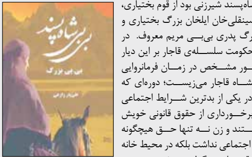
بی‌بی‌شاه‌پسند شیرزنی بود از قوم بختیاری،