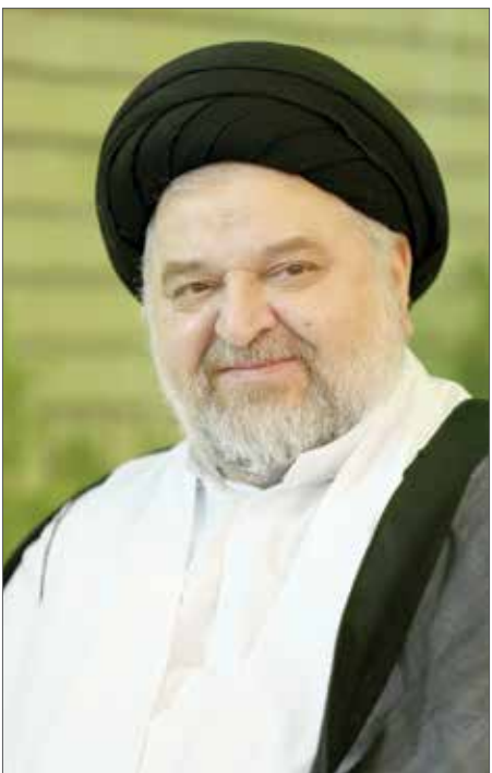
حجت‌الاسلام و المسلمین شهرستانی:

تا دیر نشده مسئولان فکر اساسی برای حل مشکلات مردم کنند