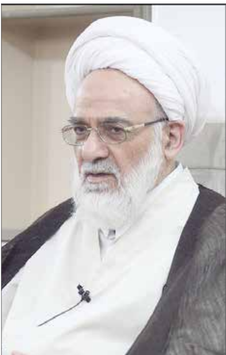
آیت‌الله گرامی قمی:

مشکلات فعلی جامعه به هیچ وجه در شأن این مردم نیست