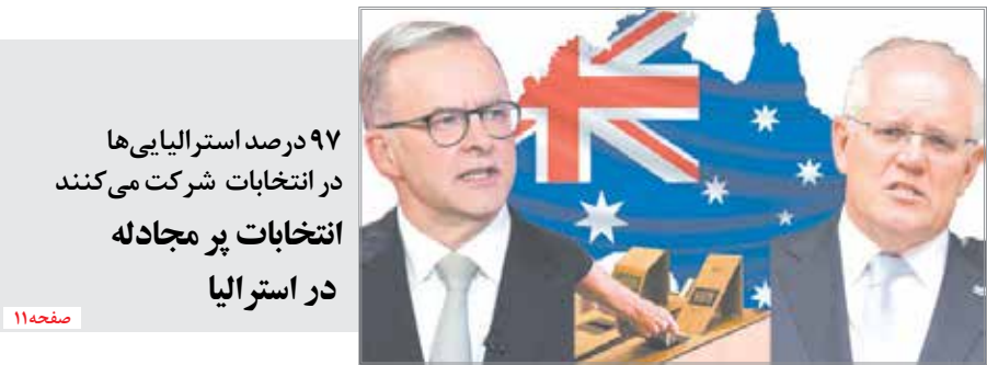
۹۷ درصد استرالیایی‌ها در انتخابات شرکت می‌کنند انتخابات پر مجادله در استرالیا