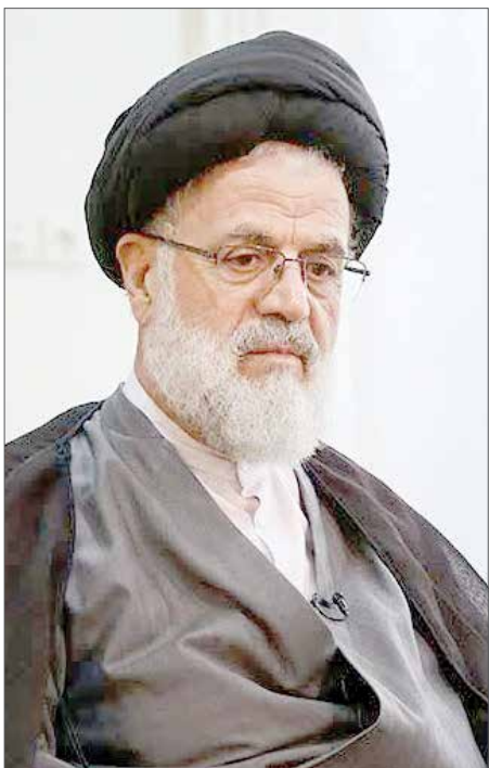
آیت‌الله موسوی تبریزی:

هزینه معضلات کشور را اقتدار پایین دست جامعه پرداخت می‌کنند