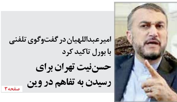
امیر عبداللہیان در گفت‌وگوی تلفنی با بولر تاکید کرد حسن نیت تهران برای رسیدن به تفاهم در وین