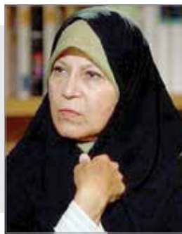
کیفر خواست فائزه هاشمی صادر شد