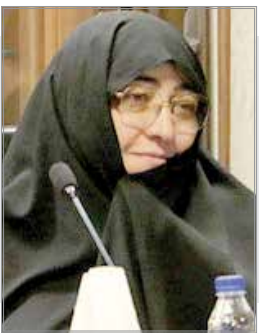
رئیس و قالیباف بیشتر از ما برای حقوق کارگران روضه می خوانندند اما...!