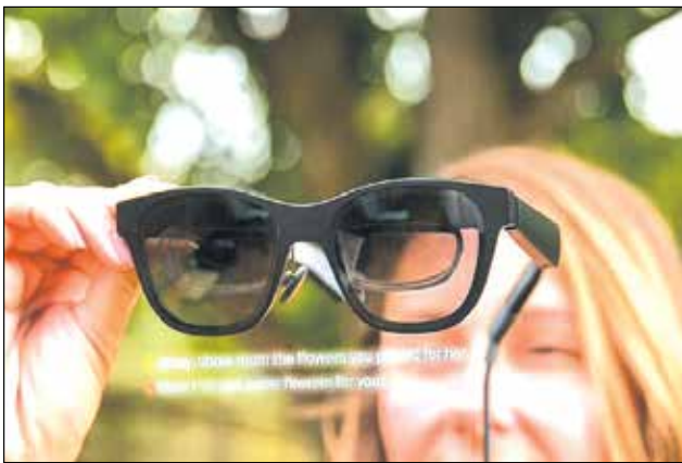
عینک AR Nreal

سخت افزار این عینک توسط شرکت عینک‌سازی «AR Nreal» با استفاده از عینک «Nreal Air» توسعه داده شد و این درحالی است که «XRAI Glass» نرم افزار آن را ارائه کرده است. این نرم افزار صدا را به یک نسخه زیرنویس شده از مکالمه تبدیل می‌کند که سپس روی صفحه عینک به نمایش در می‌آید. این عینک قادر به زیرنویس اصوات است و به لطف قابلیت‌های تشخیص صدا، این عینک حتی می‌تواند تشخیص دهد که چه کسی صحبت می‌کند و به زودی خواهد توانست زبان‌ها، تُن صدا، لهجه‌ها و زیر و بم صدا را ترجمه کند.