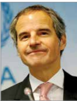
برنامه هسته‌ای ایران در حال گسترش است