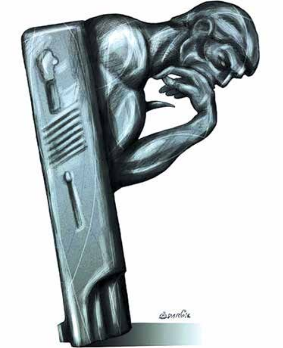
تفکر و اسلحه