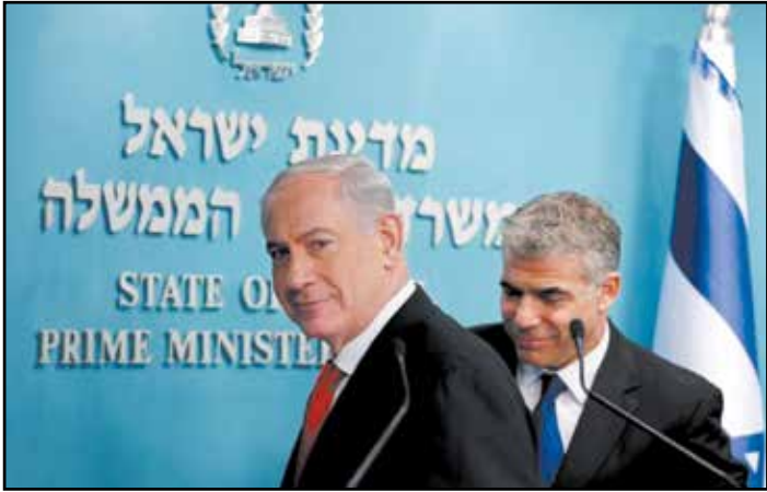
«یابرد لاپید» نخست وزیر رژیم صهیونیستی ماکه حکمرانیش پایان یافته است. گفت که با توجه به روابط بهترش با دموکرات های آمریکا به «بنیامین نتانیاهو» نخست وزیر مامور تشکیل

وزیر امور خارجه آمریکا در پیامی به تکرار اظهارات مداخله‌جویانه‌اش درباره اتفاقات اخیر ایران پرداخت. به گزارش ایسنا، آنتونی بلینکن، وزیر امور خارجه آمریکا در ادامه اظهارات مداخله‌جویانه‌اش درباره اتفاقات اخیر ایران، در صفحه توئیترش نوشت: بسیار نگران این هستم که ایران، گفته‌ها، مقادام ایران در حال گسترش خشونت علیه معترضان، به ویژه در شهر مهاباد هستند. بلینکن در ادامه گفت: ما در عین حمایت از مردم ایران، به پاسخگو کردن کسانی که در این کار نقش دارند ادامه می‌دهیم. اظهارات بلینکن در حالی مطرح می‌شود که