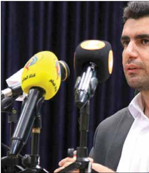
سرپرست معاونت برنامه ریزی و توسعه منابع وزارت آموزش و پرورش با بیان اینکه