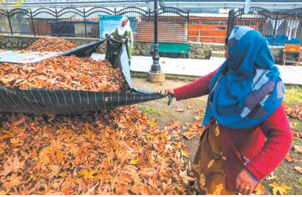
جمع‌آوری برگ‌های پاییزی برای استفاده از آنها به عنوان سوخت زمستانی در کشمیر