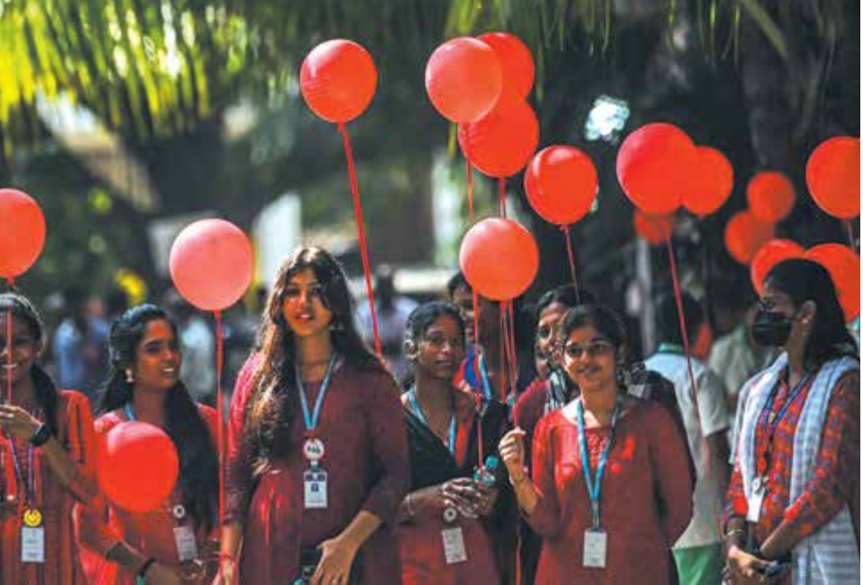
حضور دانشجویان هندی در مراسم روز جهانی ایندز