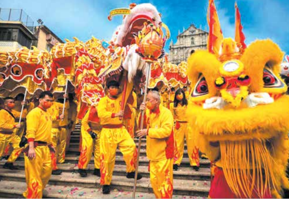
جشن سال نو چینی در ماکائو