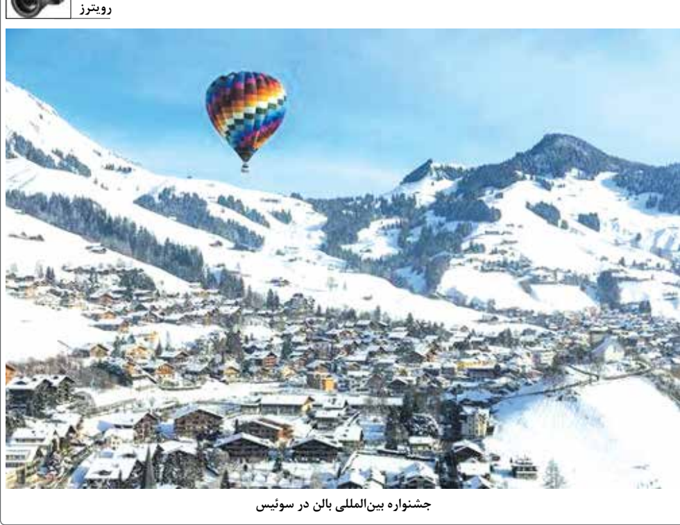
جشنواره بین‌المللی بان در سوئیس