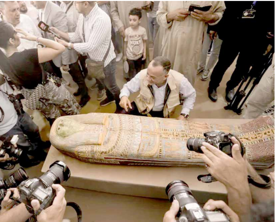
کشف یک کارگاه باستانی مومیایی انسان و حیوانات مقدس متعلق به ۲۲۰۰ سال پیش در ۲۵ کیلومتری جنوب غربی قاهره