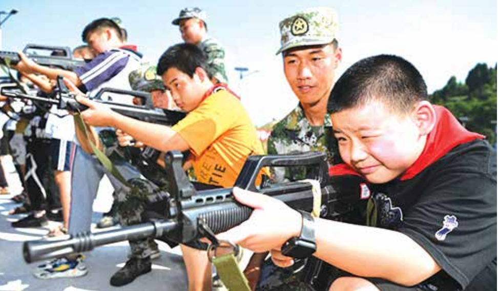
روز آموزش دفاع ملی در چین