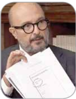
رسوایی وزیر فرهنگ ایتالیا