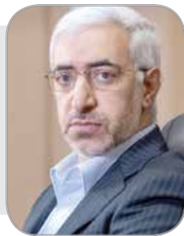
وام عشقی در وقت اضافه