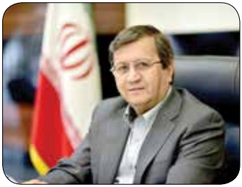
وزیر امور اقتصادی و دارایی با اشاره به سهم اندک ایران از حجم سرمایه‌گذاری مستقیم خارجی بین المللی نوشت: بدون حل موضوع تحریم‌ها و خروج از لیست سیاه FATF و داشتن مبادلات بانکی و مالی روان در سطح منطقه و جهان، سرعت جذب سرمایه و بهره‌مندی از زنجیره ارزش جهانی به‌رغم اهمیت آن، بسیار محدود خواهد بود.

«عبداناصر همتی» در یادداشتی پس از حضور در بیست و هشتمین اجلاس جهانی سرمایه‌گذاری در ریاض به اهمیت حضور ایران در این نشست پرداخت. در این یادداشت آمده است: شرکت در «اجلاس جهانی سرمایه‌گذاری» در ریاض و گفت‌وگو با وزرای شرکت‌کننده در این رخداد اقتصادی، فرصتی برای شناخت بیشتر از موقعیت و روند سرمایه‌گذاری در جهان بود. تغییر پارادایم و اثر آن بر رابطه بین سیاست صنعتی و استراتژی ترویج سرمایه‌گذاری، نه تنها مسیر آینده اقتصاد جهانی را تعیین می‌کند بلکه سرنوشت همکاری‌های بین‌المللی و کیفیت زندگی مردم در سراسر جهان را نیز شکل خواهد داد. بر اساس گزارش کنفرانس توسعه و تجارت سازمان ملل (انکتاد) حجم سرمایه‌گذاری مستقیم خارجی در ۲۰۲۳ میلادی معادل ۱.۳ تریلیون دلار بوده که سهم سرمایه‌گذاری مستقیم خارجی در ایران، در سال یاد شده، کمتر از یک در هزارم این مبلغ جهانی بوده است!